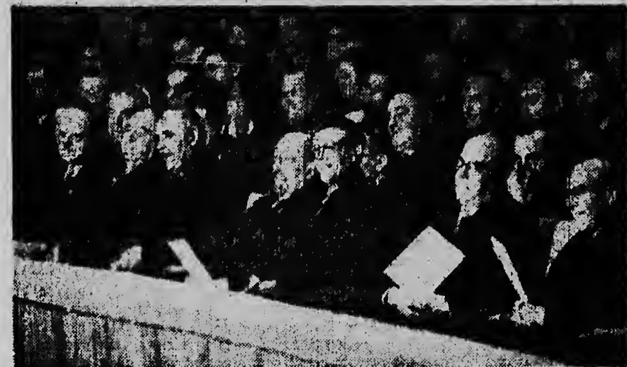
Aqui nos por forma nos mes un idea dje participantenan na e congreso di partida comunista na Moskou cu a ser teni na Kremlin. Riba e prome careda di i.p.d. bo ta mira N. M. Shvernik, J. Maurer, Ch. Cheorgiu-Dej, W. Ulbricht, M. A. Soeslof, Y. Cyrankiewicz y W. Gomoelka.